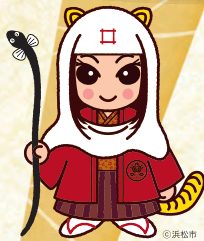
出せ法師 直虎ちゃん