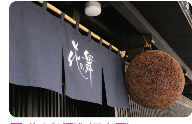
3 花の舞酒造(日本酒)